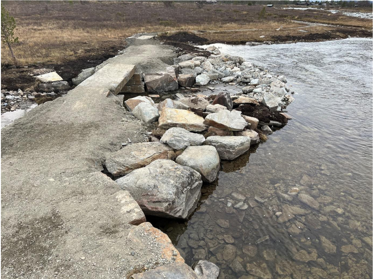
Fig. 3 Adkomst Fryosen bro – vestsida etter utbedring