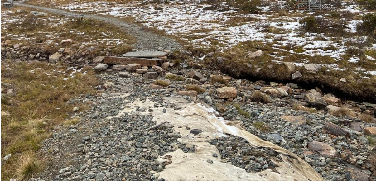
Fig. 2 Adkomst Fryosen bro – østsida før utbedring

For å avklare hvilke tiltak som skulle gjennomføres og for å involvere de aktuelle myndighetsorgan (Nasjonalparkforvalter, SNO og Nord-Fron kommune) ble det 28. juni gjennomført en befaring der også Kvamsfjellet Vel og RKT deltok. Det ble deretter utarbeidet en rapport som beskrev hvilke tiltak som skulle gjennomføres og som ble oversendt de aktuelle myndighetsorgan for godkjenning.