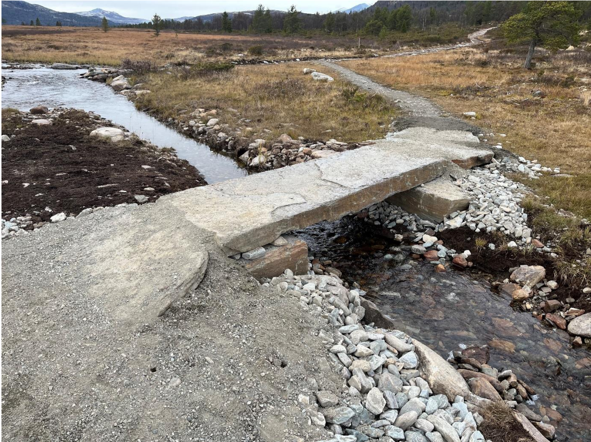
Fig. 4 Fryosen bro – adkomst østsida etter utbedring

Adkomsten inn på brua fra begge sider, er nå forsterket betydelig og det er brukt lengre og tyngre heller som gjør at den bør kunne tåle høy flomvannføring på en bedre måte. Det er nå også helt greit å sykle over brua uten å måtte gå av sykkelen. Styreleders vurdering er at det nå også ser bedre ut på begge sidene.