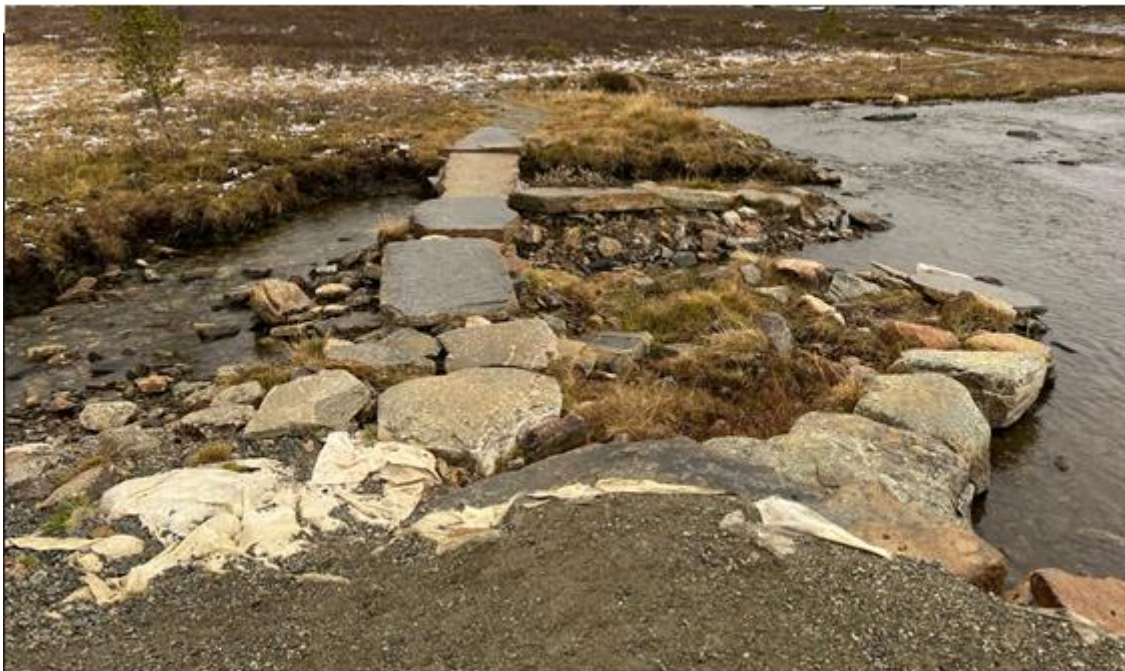
Fig. 1 Adkomst Fryosen bro – vestsida før utbedring

På de to bildene under er vist hvordan flommen hadde medført skader på adkomsten inn på brua på begge sider.